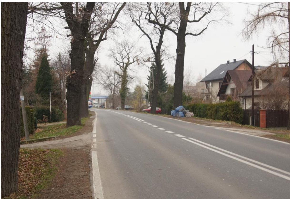
Ul. Komorowicka, od ul. Bestwińskiej (rondo) do kościoła w Komorowicach. Brak chodników; duży ruch pieszych i pojazdów. Zagrożenie zdrowia i życia pieszych, zwłaszcza starszych.