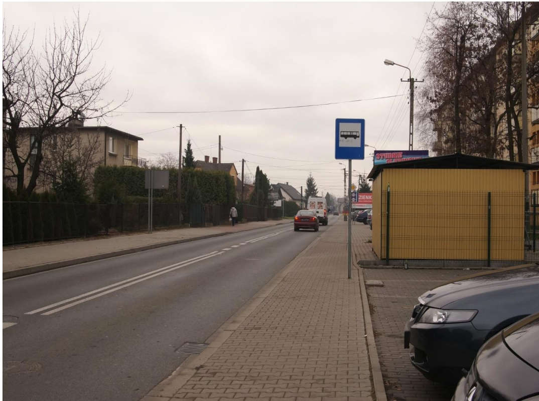
Komorowice, ul. Daszyńskiego. Przystanek bez zadaszenia i miejsc do siedzenia.