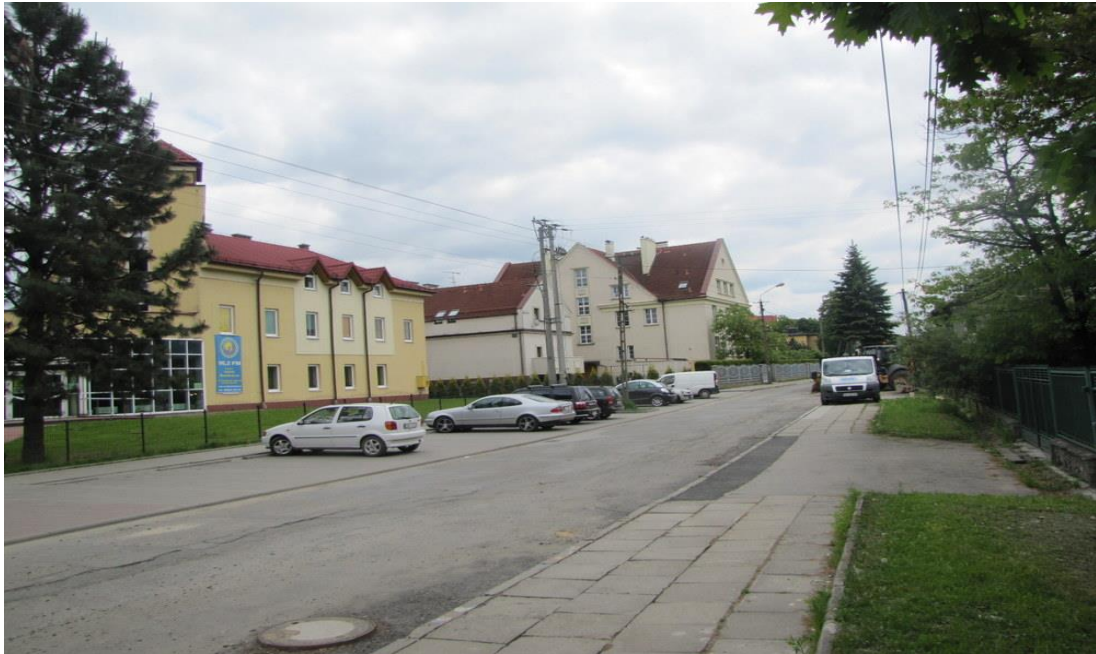
Komorowice, ul. Świętego Jana Chrzyciciela