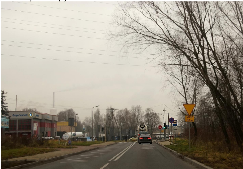
Komorowice. Ul. Grażyńskiego przy skrzyżowaniu z ul. Mazańcowicką. Przystanek autobusowy bez zadaszenia i miejsc siedzących.

Projekt współfinansowany z Funduszy EOG w ramach programu Obywatele dla Demokracji