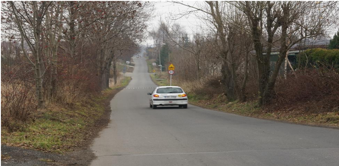
Ul. Barkowska; brak chodników na całej długości ulicy.