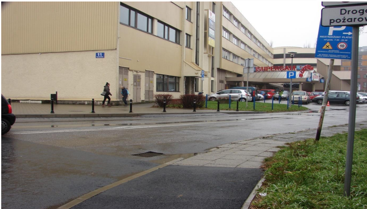
Ulica Cyniarska - Śródmieście Białe

5. Chodniki nie są śliskie, są wystarczająco szerokie dla wózków inwalidzkich i mają krawężniki na poziomie jezdni.