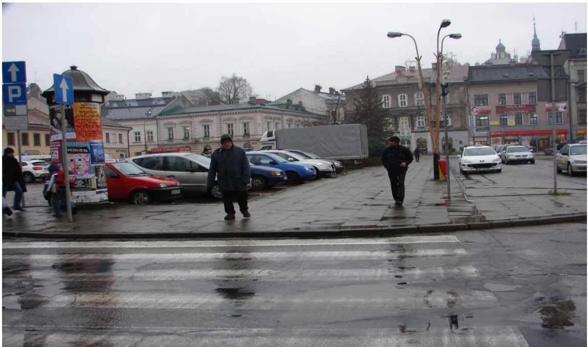
Plac Wojska Polskiego