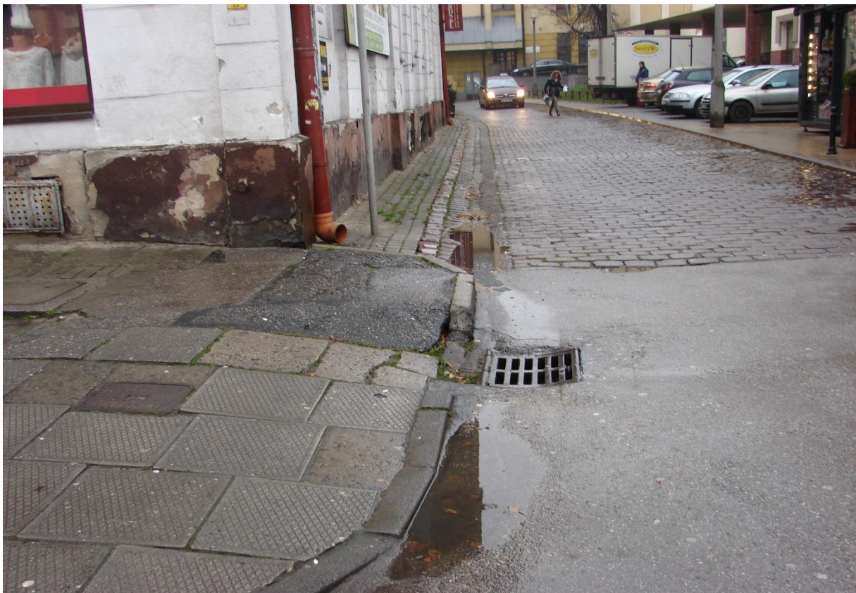
Plac Wojska Polskiego i ul. Łukowa - Śródmieście Białe

Projekt współfinansowany z Funduszy EOG w ramach programu Obywatele dla Demokracji