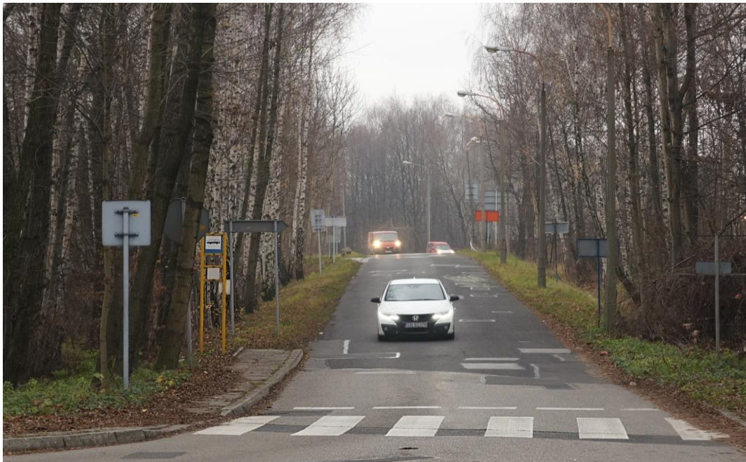
Komorowice. Zjazd z ul. Warszawskiej do Mazańcowickiej. Przystanek autobusowy bez zadaszenia i miejsc siedzących.