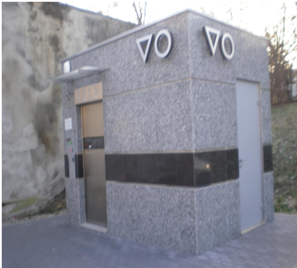
Ul. Mikołaja Kopernika – Stare Miasto

Projekt współfinansowany z Funduszy EOG w ramach programu Obywatele dla Demokracji