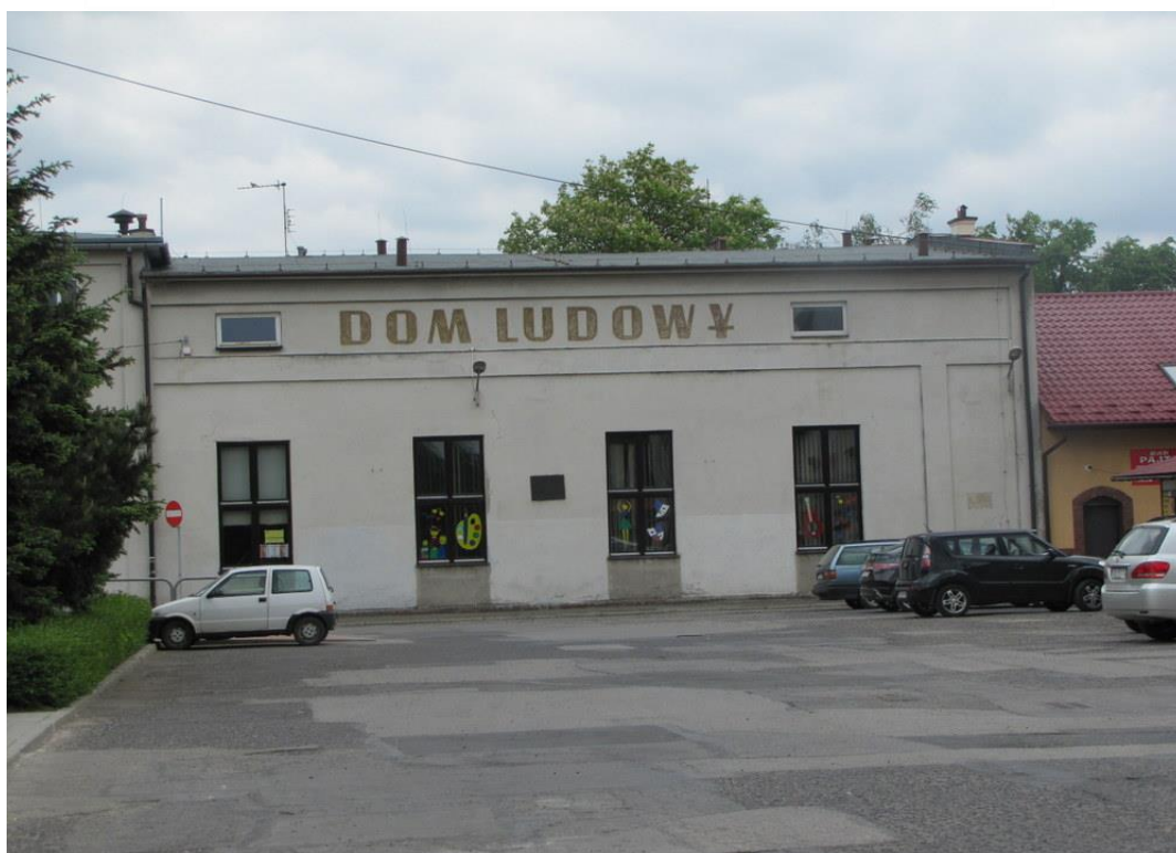
Komorowice, pl. J Niemczyka