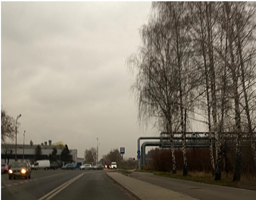
Komorowice. Ul. Grażyńskiego przy zakładach FIATA. Przystanek autobusowy bez zadaszenia i miejsc siedzących.